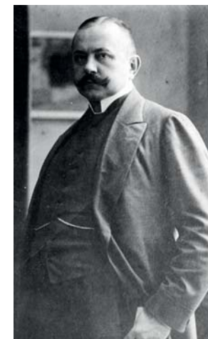
Prezydent Krakowa Juliusz Leo (1861–1918)

Zmarł 21 lutego 1918 r. i został pochowany na cmentarzu Rakowickim.