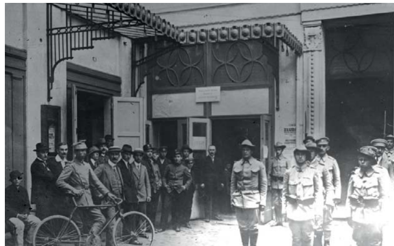
Biuro werbunkowe Legionów Polskich na dziedzińcu Pałacu Spiskiego w Krakowie. Widoczny wojskowy z rowerem

Atmosferę w 1914 r. relacjonował niemal na bieżąco anonimowy autor: Już od pierwszej chwili otwarcia biur, podwórze i sale zaroily się ochotnikami, którzy stawali do asenterunku. Od wczesnego ranka do późnego wieczora przed Komisją poborowo-lekarską przesuwały się długie szeregi tych, którzy już po kilku tygodniach, jako żołnierze 2. i 3. pułku, ciągnęli „Drogę Legionów” przez przetęcz Pantyrską w Karpatach i otrzymawszy chrzest krwi w pierwszej walnej bitwie pod Mołotkowem, okryli się chwałą pod Pasieczną, pod Zieloną, pod Rafajłową i na Bukowinie.