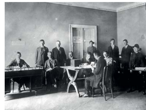
Biuro werbunkowe w Pałacu Spiskim

21 sierpnia 1914 r. rozpoczął tutaj działalność Centralny Oddział Werbunkowo-Ewidencyjny Departamentu Wojskowego Naczelnego Komitetu Narodowego. Symboliczny w swej wymowie przypadek sprawił, że niemal sto lat wcześniej w Pałacu Spiskim kwaterował książę Józef Poniatowski, wódz naczelny wojska polskiego.