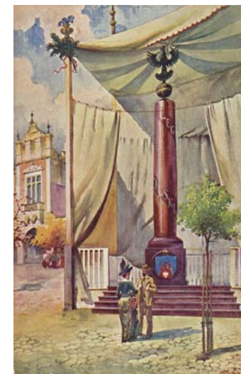
S. Tondos, autor wzoru, wydano nakładem Komitetu Kolumny Legionów

Nad całością prac czuwał Departament Organizacyjny Naczelnego Komitetu Narodowego. Po zakończeniu akcji tarcze obite gwoździami wraz z zebranymi funduszami miały wracać do Krakowa, będąc wymownym świadectwem patriotycznej postawy Polaków. Kolumna krakowska nie przetrwała do naszych czasów, nie są znane jej losy w czasie II wojny światowej. Zachowało się tylko zwieńczenie przechowywane w zbiorach Muzeum Historycznego Miasta Krakowa, tam również znajduje się szereg tarcz legionowych, m.in. z takich miejscowości jak Sucha, Tarnobrzeg, Sambor, Żółkiew, Rudki, Złoczów.