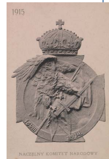
Pocztówka wydana przez wiedeńskiej Delegację Polskiego Samarytana

W Krzysztoforach znalazły się także biura Komendy Placu, Komendy Etapu i Prowiantury Legionów. Na pierwszym piętrze sale zajmował Oddział Kwaterunkowy dla legionistów przybywających do Krakowa, także poczta polowa. Na