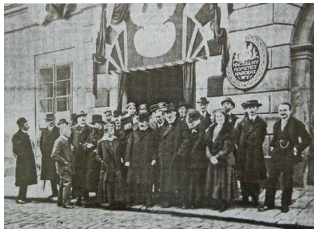
Pracownicy NKN przed budynkiem przy ul. Gołębiej

Leon Biliński (1846–1923) ekonomista, naukowiec, polityk, wpływowa postać w Galicji w czasach schyłku monarchii austro-węgierskiej. Był również posłem i wysokim urzędnikiem w Wiedniu, rektorem Uniwersytetu Lwowskiego, a w latach 1916–1920 kierował Naczelny Komitetem Narodowym. W rządzie Ignacego Paderewskiego pełnił funkcję ministra skarbu