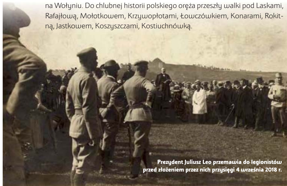
Prezydent Juliusz Leo przemawia do legionistów przed złożeniem przez nich przysięgi 4 września 2018 r.

Ostatecznie w latach 1914–1916 sformowano siedem pułków piechoty legionowej: 1, 5 i 7 pułk wszedł w skład I Brygady brygadiera Józefa Piłsudskiego, 2 i 3 pułk – II Brygady płk. Zygmunta Zielińskiego, następnie płk. Józefa Hallera, 4 i 6 pułk – III Brygady, którą dowodzili płk Wiktor Grzesicki i płk Bolesława Roja. Sformowano też dwa pułki kawalerii, pułk artylerii, inne oddziały pomocnicze. Legioniści walczyli na różnych frontach: I Brygada oraz III Brygada na ziemiach polskich, II Brygada w Karpatach Wschodnich. Z końcem 1915 r. i w 1916 r. wszystkie oddziały legionowe spotkały się na Wołyniu. Do chlubnej historii polskiego oręża przeszły walki pod Laskami, Rafajłową, Mołotkowem, Krzywopłotami, Łowczówkiem, Konarami, Rokitną, Jastkowem, Koszyszcami, Kostiuchnówką.