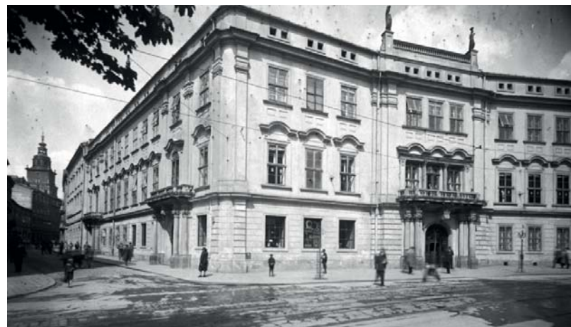
Pałac Larischa w latach 30. XX w.