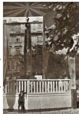
Kolumna Legionów na Ryńku krakowskim