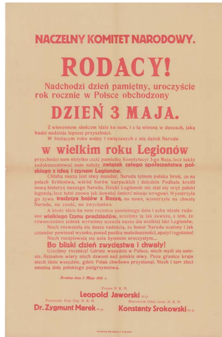
Druk ulotny, Odezuwa Naczelnego Komitetu Narodowego związana z dniem 3 maja

w Wiedniu, Delegacja NKN we Lwowie, Delegacja NKN do Królestwa Polskiego, Departament Wojskowy z oficerami werbunkowymi w różnych miastach Królestwa, Departament Organizacyjny, Departament Skarbowy, Liga Kobiet NKN, Komitet Opieki nad byłymi legionistami oraz wdowami i sierotami po poległych legionistach, szpitale dla legionistów, schroniska, ambulatoria. Pracowało dla NKN-u wiele często bardzo znanych osób.