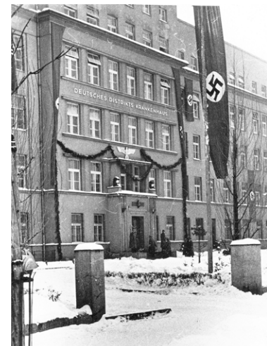
Szpital w czasie okupacji, 1940