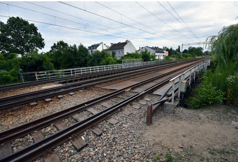
Tor kolejowy między Żabińcem a ul. Langiewicza

dla obu odcinków oddzielnie, gdy wpłynie odwołanie od pierwszej z wydanych decyzji, złożenie wniosku o wydanie decyzji dla drugiego odcinka będzie wstrzymane.