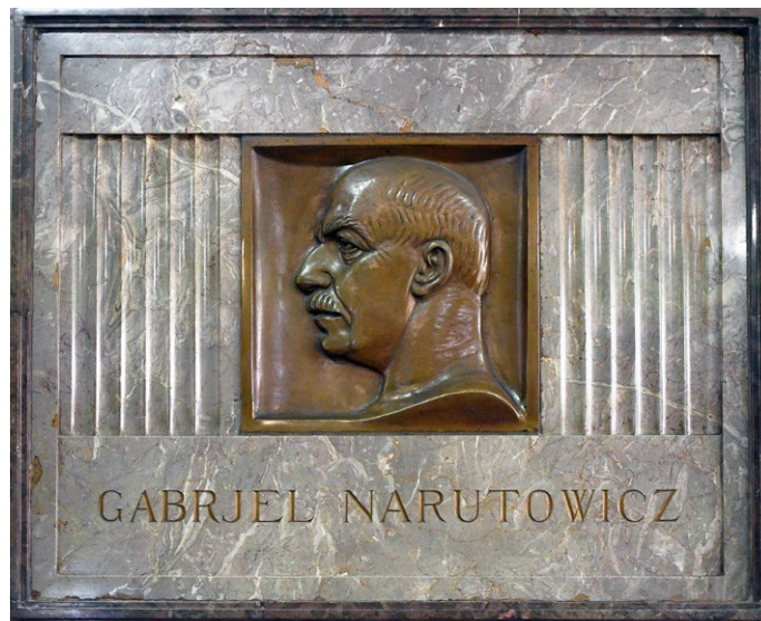
Tablica w holu szpitala

Gabriel Narutowicz urodził się 17, a według niektórych źródeł – 29 marca 1865 r. w Telszach w guberni kowieńskiej. Jako inżynier hydrotechnik, elektryk, kierował budową hydroelektrowni w różnych krajach Europy. Przez wiele lat przebywał w Szwajcarii, był m.in. profesorem Politechniki w Zurychu oraz członkiem szwajcarskiej komisji gospodarki wodnej. W 1919 r. przybył do Polski i brał czynny udział w odbudowie państwa po zaborach. W czerwcu 1920 r. objął funkcję ministra robót publicznych, a od czerwca 1922 – ministra spraw zagranicznych. 9 grudnia 1922 r. został pierwszym prezydentem Rzeczypospolitej Polskiej. Wybór na urząd prezydenta przesądziły głosy lewicy, mniejszości narodowych oraz PSL „Piast”. Wynik wyborów wywołał demonstracje przedstawicieli Narodowej Demokracji, pod hasłami „Precz z Narutowiczem” i „Precz z wybranym Żydem”. W dniu zaprzysiężenia, 11 grudnia 1922 r. w Warszawie trwały zamieszki zorganizowane przez skrajną prawicę. Później prezydent Narutowicz otrzymywał listy z pogróżkami. W końcu, 16 grudnia, tydzień po objęciu urzędu, podczas wizyty w galerii „Zachęta” Narutowicz został zastrzelony przez malarza Eligiusza Niewiadomskiego, związanego z endecją. Zamachowca skazano na śmierć i stracono 31 stycznia 1923 r.