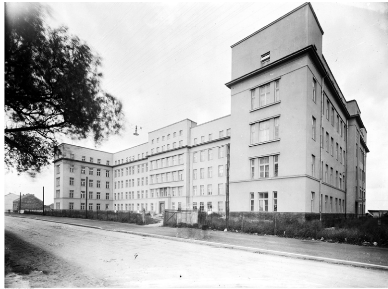
Szpital w czasie budowy, 1934

W styczniu 1945 r. pociski artyleryjskie zburzyły dwa skrzydła budynku, dopełniając ruiny. Po wkroczeniu Rosjan, w części obiektu znajdował się szpital polowy, drugą część oddano Ubezpieczalni Społecznej. Do pracy wróciła większość przedwojennego personelu. Rozpoczął się proces odbudowy i uzupełniania wyposażenia, w latach 1946-1948 uruchamiano kolejne oddziały. W 1954 r. do szpitala przyłączono sąsiedni budynek Zakładu Wychowawczego im. ks. Siemaszki, następ-