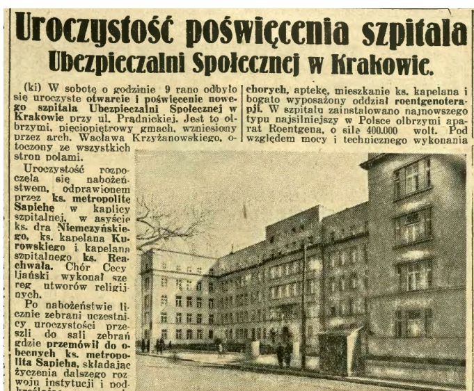
Wycinek z „Ilustrowanego Kuriera Codziennego”, 12 listopada 1934