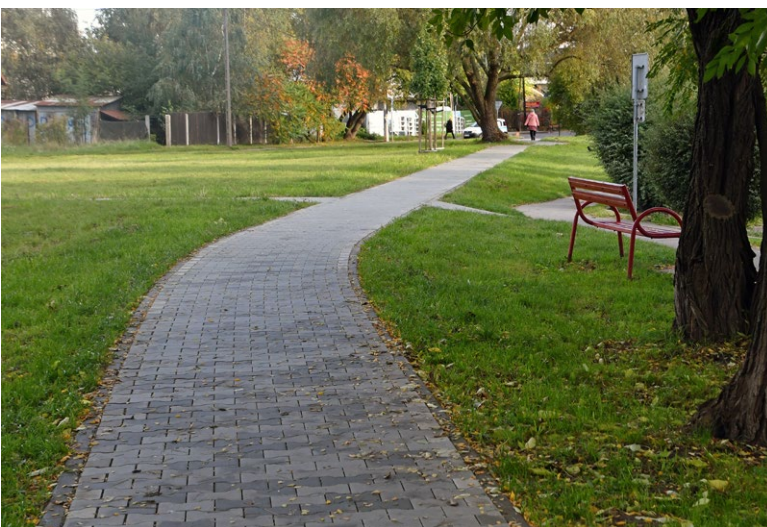
Ciąg pieszy od ul. Jabłonnej w kierunku ul. Siewnej