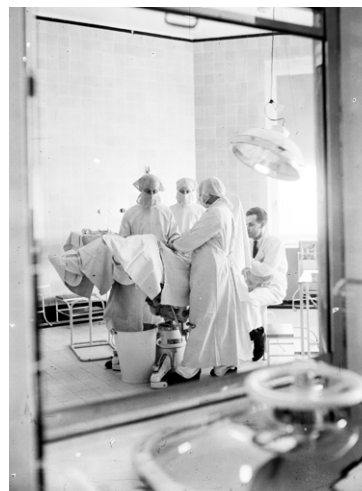
Sala operacyjna, 1936