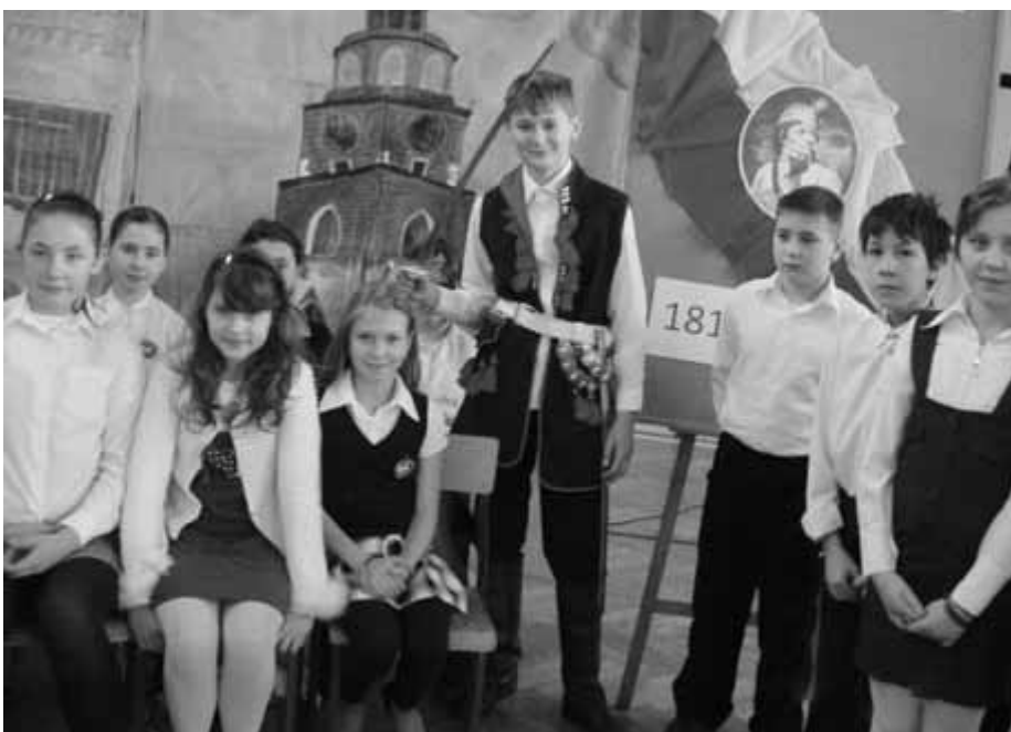
Uroczysty apel poświęcony patronowi.

Tadeusz Kościuszko – generał polski i amerykański, Najwyższy Naczelnik Siły Zbrojnej Narodowej, wielki człowiek, z którego możemy brać przykład i dzisiaj. Nasi uczniowie na co dzień odkrywają, jak aktualne są wskazówki, które im, i nam wszystkim, pozostawił Kościuszko: unikaj kłamstwa, szukaj prawdy, nie zaniedbuj okazać wdzięczności, bądź twardym dla siebie, ale wyrozumiałym dla innych, bądź grzecznym i uczciwym wobec każdego, miłym i uprzejmym w towarzystwie, zawsze ludzkim i wspomagającym w miarę możliwości nieszczęśliwych. Tego uczymy każdego dnia wychowanków Szkoły noszącej imię Tadeusza Kościuszki.