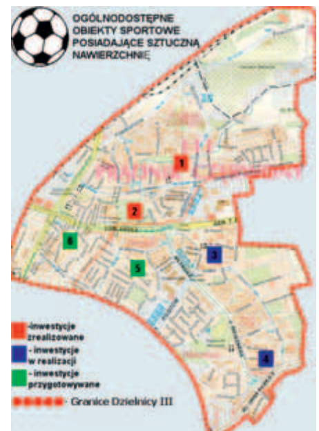
Opracowanie mapy i zdjęcia Dominik Jaśkowiec