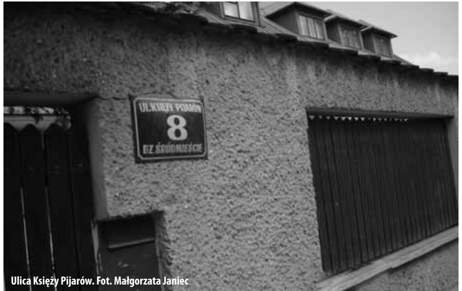
Ulica Księża Pijarów.

Kalasancjusz wprowadził całkowicie rewolucyjny system nauki. Opierał się na twierdzeniu, iż uczeń posiada swoją godność. Zakazał stosowania kar cielesnych, twierdził, że nauczyciele powinni zachęcać uczniów do zdobywania wiedzy. Oparł naukę na okazywaniu uczniom serca i cierpliwości zamiast przymusu. Bardzo nowatorskim rozwiązaniem w szkołach pijarskich było przezwyciężenie wszelkiej dyskryminacji rasowej i religijnej. Owoce pracy wychowawczej z dziećmi i młodzieżą bez barier między ubogimi i bogatymi pozwoliły wyrównać szanse startu życiowego jednych i drugich.