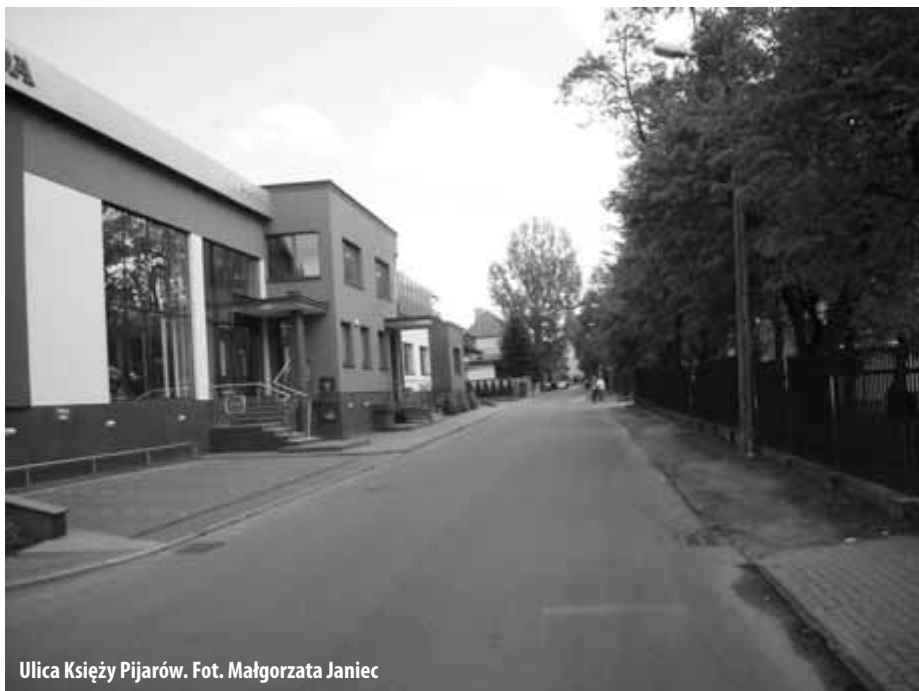
Ulica Księża Pijarów.