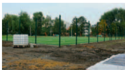
Budowa boiska wielofunkcyjnego w Parku Zaczarowanej Dorożki w 2010 roku