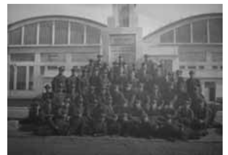
Lotnicy 2. Pułku przed pomnikiem.

Artykuł jest rozszerzeniem publikacji na temat pomnika pod tytułem „Pamięci poległych lotników z Krakowa”, która ukazała się w „Gazecie Krakowskiej” 13 maja 2011 roku.