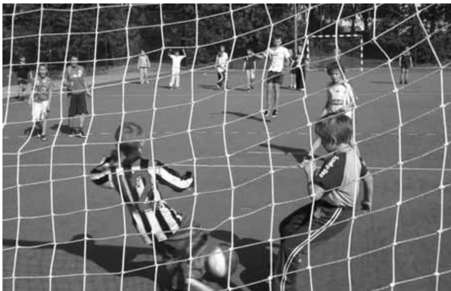
Na boiskach wybudowanych przez Radę naszej Dzielnicy rosną nasi następcy.

Bardzo dziękuję władzom klubu KS „Prądniczanka” za udostępnienie strojów sportowych, wprawdzie w tych rozgrywkach nie przynieśliśmy chwały barwom, ale turniej wyzwolił żądzę rewanżu. Ekipa Prądnika Czerwonego uzgodniła z sąsiadami z zachodu – z Dzielnicą IV, że będziemy rozgrywać cykliczne spotkania treningowe, aby w przyszłej edycji umożliwić innym zajęcie ostatniego miejsca. Będę się również kontaktował z Kolegami z Dzielnic XIV i XV, aby stworzyć cykliczne rozgrywki „Kraków – Huta – nie ma granic”. Miejscem heroicznego zmagania będzie boisko na terenie Parku Zaczarowanej Dorozki.