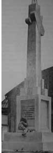
Pomnik w trakcie budowy.

W południe odbył się wspólny żołnierski obiad, a po południu – mecz piłkarski między drużynami krakowskiego i lwowskiego pułku lotniczego. Krakowianie nie dali sobie zepsuć święta i wygrali 4-1. Wieczorem, na zakończenie 3-dniowego jubileuszu odbyła się akademie w Teatrze Starym, przed którą publiczność mogła obejrzeć film nakręcony z lotów nad miastem przez lotników krakowskich.