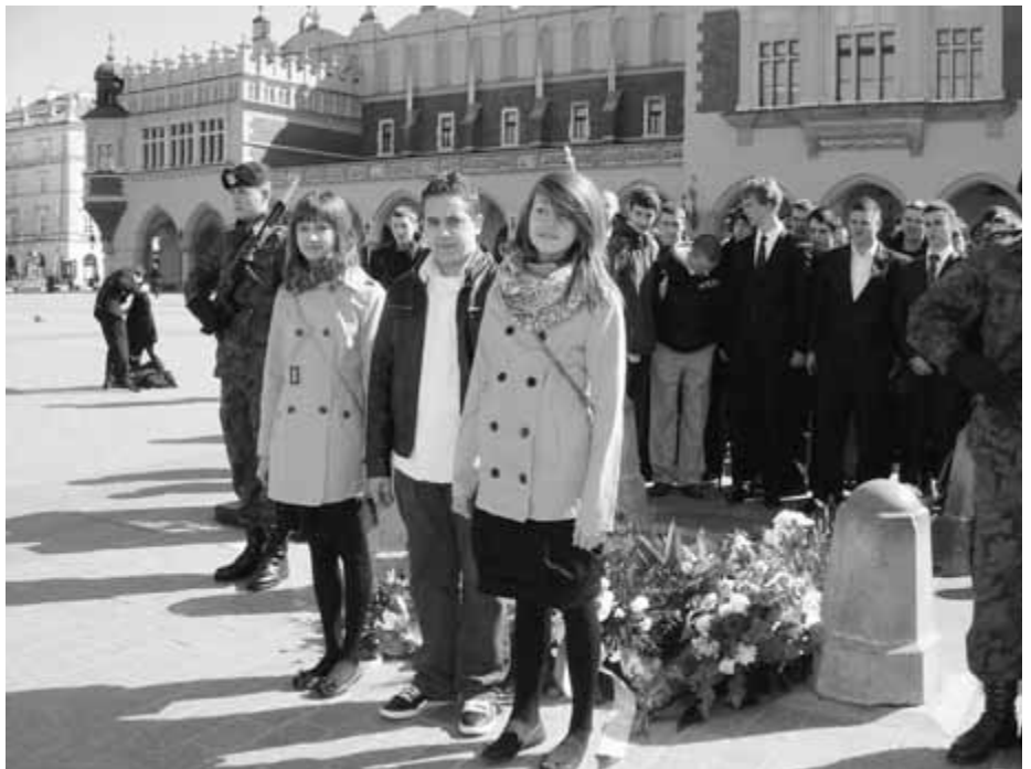
Uroczystości na płycie Rynku Głównego.