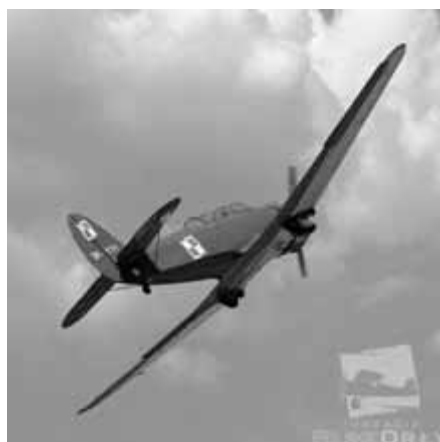
Jak-18 w locie.

Jak-18 został skonstruowany w 1946 r. w biurze konstrukcyjnym A. Jakowlewa, a jego pierwsza prezentacja miała miejsce podczas XXI Międzynarodowych Targów Poznańskich w 1948 r. Maszyna ta okazała się bardzo udaną konstrukcją, produkowaną masowo i eksportowaną do wielu krajów, jako podstawowy sprzęt szkolny armii i aeroklubów. W latach 1947-1975 powstało łącznie 8.334 egzemplarzy tego samolotu. W Polsce płatowce Jak-18 użytkowane były przez lotnictwo wojskowe od 1949 r. do końca lat 50.