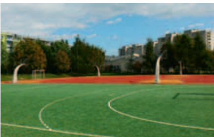
Nawierzchnia boisk sportowych w 2008 roku