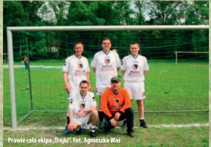
Prawie cała ekipa „Trójki”.