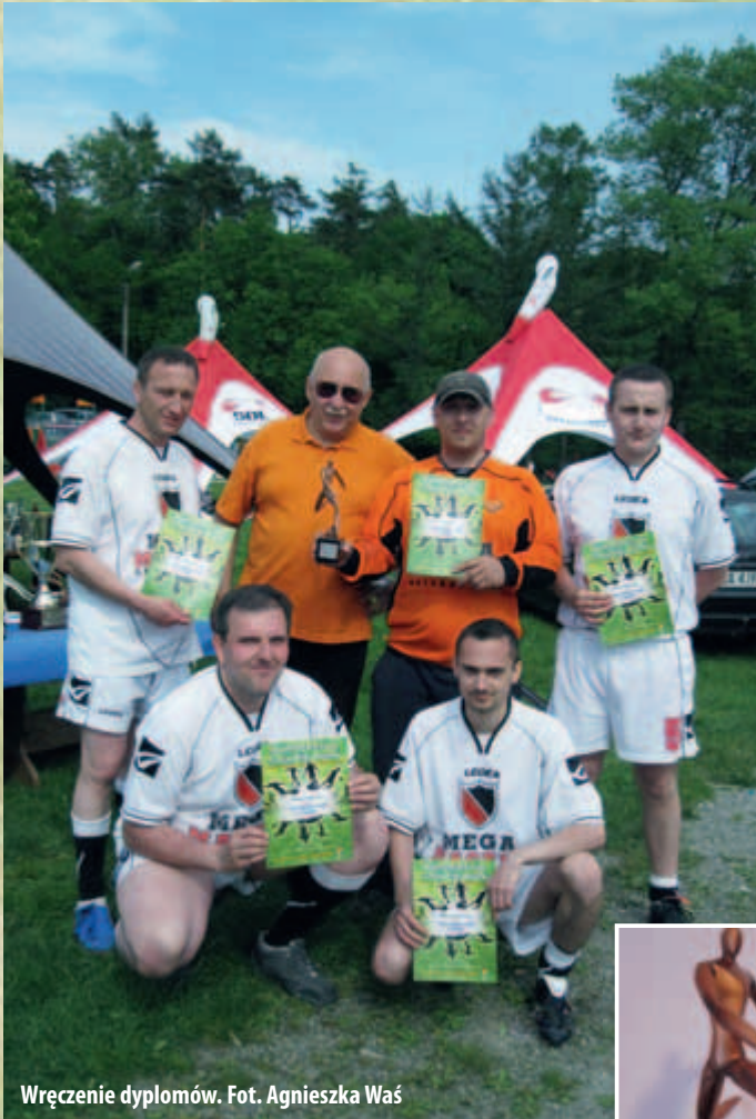
Wręczenie dyplomów.