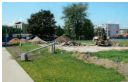
Budowa boiska wielofunkcyjnego w Parku Zaczarowanej Dorożki w 2010 roku