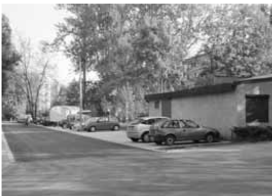
Wyremontowany parking.

Zabudowa przy ul. Miechowity charakteryzuje się sporym zagęszczeniem bloków i stosunkowo małą powierzchnią parkingową. W latach, gdy bloki były budowane, architektom do głowy nie przyszło, że niemal każda rodzina będzie mieć samochód. Z tego też powodu miejsc parkingowych jest tutaj jak na lekarstwo. Jakkolwiek sytuacja taka nie sprawiała problemów kilkadziesiąt lat temu, tak obecnie występują spore komplikacje ze znalezieniem wolnych miejsc postojowych. Dlatego też cieszy każde nowopowstałe takie miejsce. 5 maja 2011 roku radni Dzielnicy oficjalnie odebrali rozbudowany parking przy ul. Miechowity 15. Z pewnością pozwoli on, przynajmniej częściowo, rozwiązać bolączki mieszkańców, którzy każdego dnia tracą sporo czasów i nerwów próbując zaparkować swoje samochody.