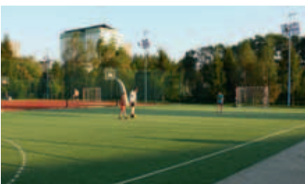
Boiska sportowe Szkoły Podstawowej nr 2 w 2010 roku