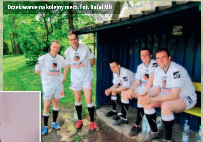
Oczekiwanie na kolejny mecz.