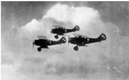
Klucz krakowskich myśliwców Spad-61.