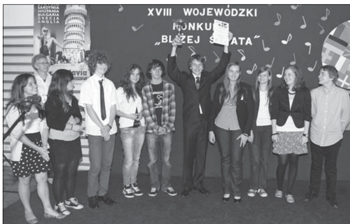
Puchar Małopolskiego Kuratora Oświaty w kategorii gimnazjów zdobyło Publiczne Gimnazjum nr 2 w Chrzanowie

Wśród dzieci starszych klas najlepiej z językiem niemieckim poradzili sobie uczniowie SP nr 10 (Zespół Szkół nr 2) oraz SP nr 68 z Krakowa – dwie równorzędne, pierwsze nagrody. Kolejne miejsca zajęli uczniowie: SP nr 97 i SP nr 104, obie szkoły z Krakowa. W grupie najmniej popularnego języka esperanto przyznano tylko jedną nagrodę – II miejsce w kategorii szkół podstawowych (dzieci młodsze) dla uczniów SP w Czajowicach.