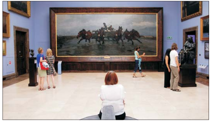
„Czwórka” Józefa Chełmońskiego w Muzeum Narodowym w Sukiennicach

Był realistą, ale realistą nietypowym, dlatego krytykowanym. Początkowo jego obrazy rzadko znajdowały nabywców, dlatego był zmuszony żyć bardzo skromnie. W latach 1871-75 Chełmoński studiował malarstwo w Monachium. Tam związał się z grupą polskich artystów skupionych wokół Józefa Brandta i Maksymiliana Gierymskiego. W tym środowisku wyróżniał się nie tylko tematyką obrazów, ale też ubiorem - nosił czapkę konduktora Kolei Warszawsko-Wiedeńskiej. Do tego kurtkę ulańską i... rajtuzy rosyjskiej konnicy. W 1875 roku przeniósł się do Paryża, gdzie pracował jako ilustrator w „Le Monde Illustré”. Dopiero wtedy zyskał popularność. Obok tematyki wiejskiej i scen rodzajowych ( Przed burzą , Babie lato , Sprawa u wójta , Przed deszczem , Na folwarku ), malował rozpędzone końskie zaprzęgi – słynne „czwórki” i „trójki”, m.in. najbardziej znany obraz – Czwórka (Po stepach) oraz krajobrazy, najczęściej Mazowsza oraz Podola i Ukrainy, do-