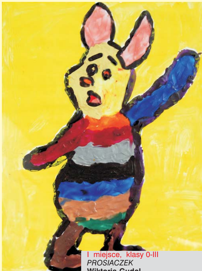
I miejsce, klasy 0-III PROSIACZEK Wiktoria Gudel oddział przedszkolny, SP nr 119