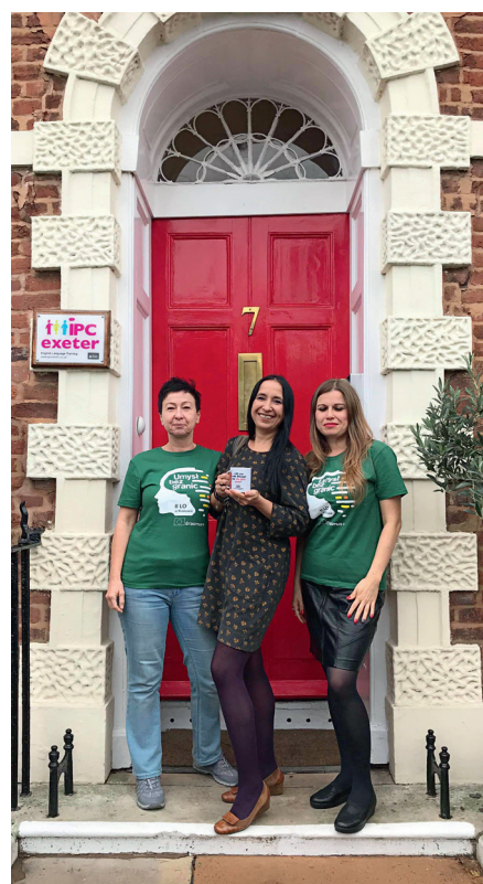
Kurs 2.