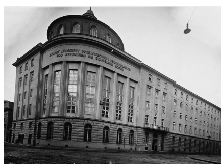
Gmach Związku Młodzieży Rękodzielniczej i Przemysłowej księdza Kuznowicza przy ulicy Skarbowej w Krakowie, 1938 r., MHK fs2191-IX