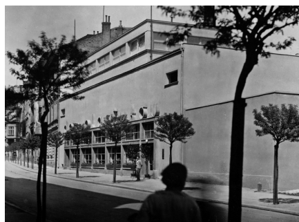
Dom Plastyków przy ul. Łobzowskiej 3, Antoni Pawlikowski, ok. 1935 r., MHK fs16925-IX