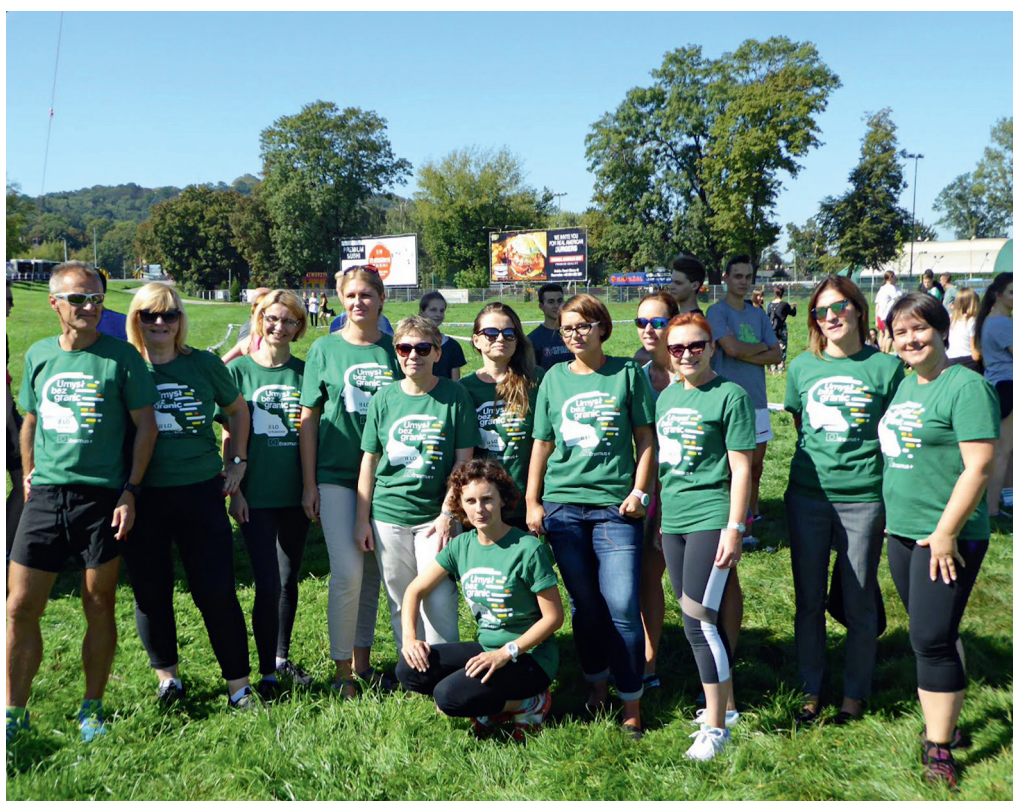
Uczestnicy projektu.