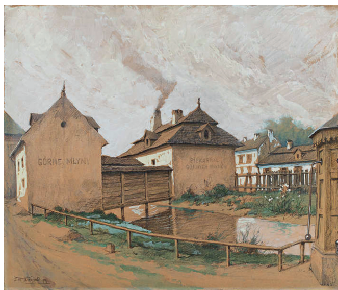
Widok Górnych Młynów nad rzeczką Młynówką, istniejących dawniej między ulicami Łobzowską i Asnyka, wg stanu z 1900 r., mal. Zygmunt Wierciak, Kraków, 1947 r., ołówek, gwasz, MHK-509/III

Muzeum Krakowa zaprasza od 21 września 2019 r. do oddziału Dom Zwierzyniecki przy ul. Królowej Jadwigi 41 na wystawę poświęconą historii i rozwojowi Garbar, dawnej krakowskiej jurydyki, która obecnie leży w granicach Dzielnicy I Stare Miasto.