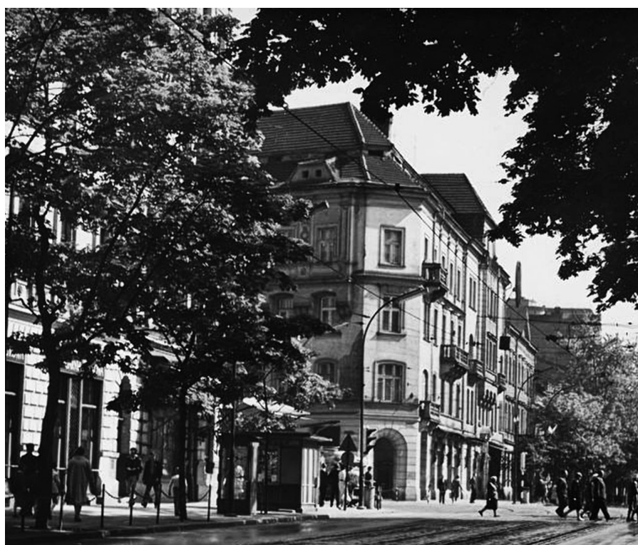
Widok z ul. Podwale w kierunku ul. Dunajewskiego, fot. Henryk Hermanowicz, l. 50/60. XX w., MHK-Fs21699/IX